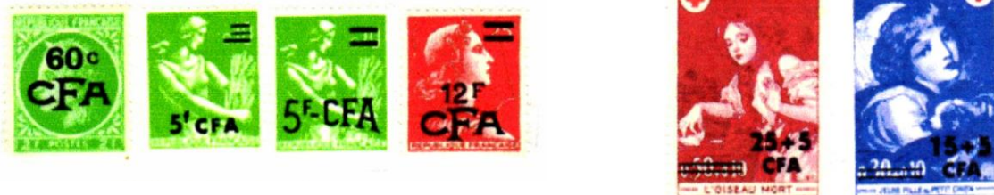
Différents types de surcharges CFA

(Ces timbres sont répertoriés dans les catalogues "OUTRE-MER ."