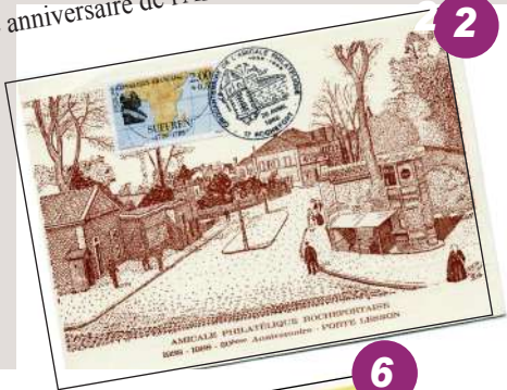
50e anniversaire de l'Amicale Philatélique Rochefortaise