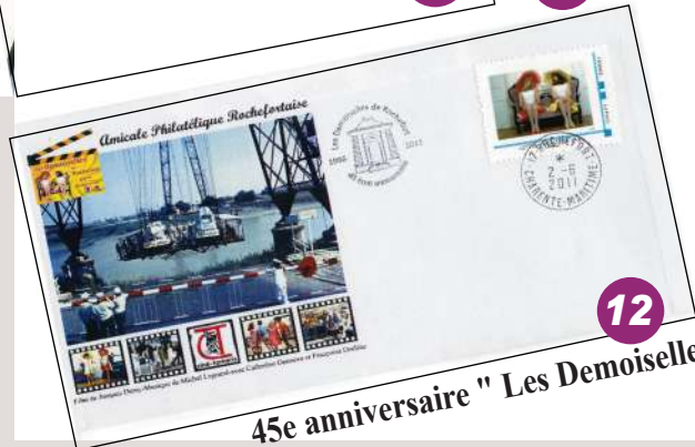
45e anniversaire " Les Demoiselles de Rochefort "