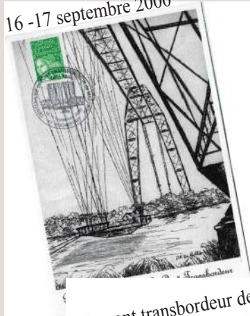
Centenaire du pont transbordeur de Martrou