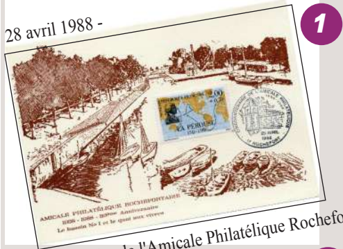
50e anniversaire de l'Amicale Philatélique Rochefortaise