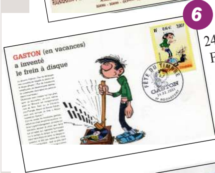
24 février 2001 FÊTE du TIMBRE