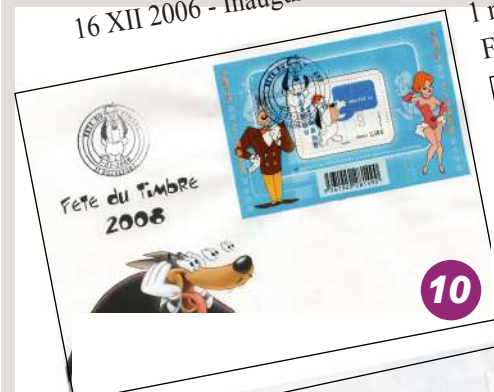
1 mars 2008 - FÊTE du TIMBRE