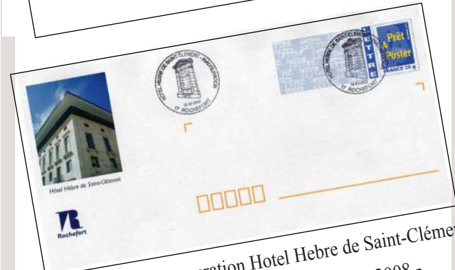
16 XII 2006 - Inauguration Hotel Hebre de Saint-Clément

1er COUVIGE INTERNATIONAL 17620 Échillais 10 - 11 juin 2006